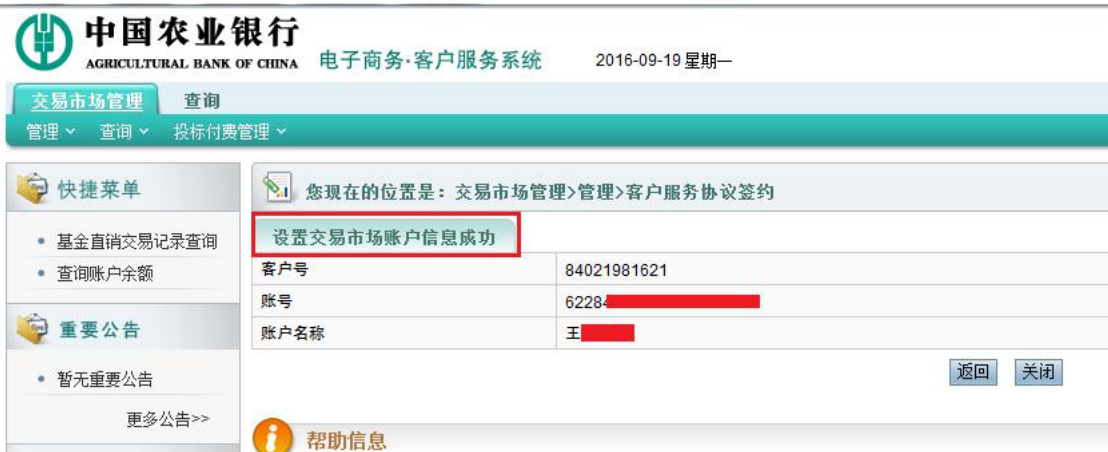
图 1- 7